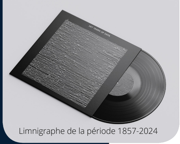
Limnigraphe de la période 1857-2024