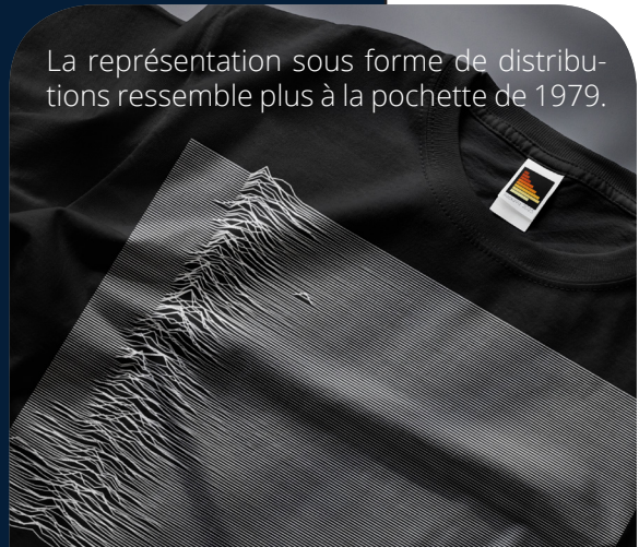
La représentation sous forme de distributions ressemble plus à la pochette de 1979.