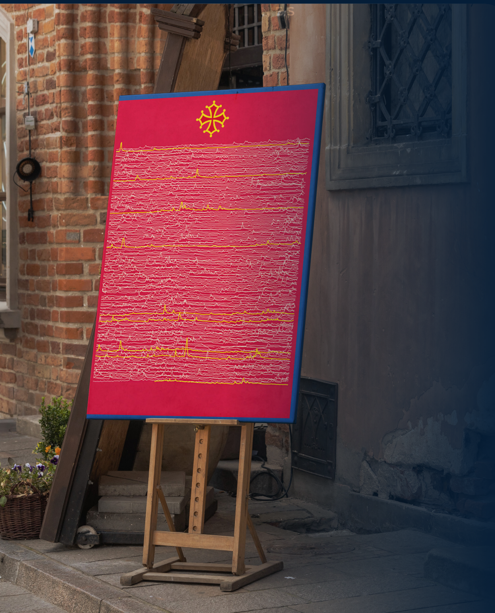
Les neuf crues de la Garonne aux couleurs de l'Occitanie.